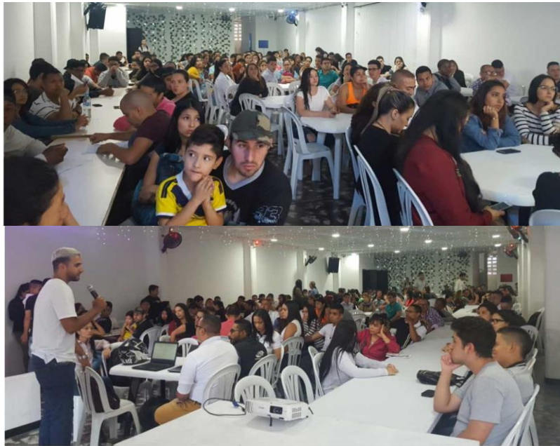
Encuentro de Estudiantes Universitarios periodo 2018-2